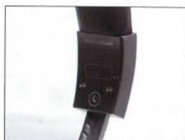
依舊德國製造，並刻於鋁合金耳機頭帶上，絕對是信心品質保證。