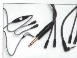
跟機配件有齊皮袋、4米長的6.3mm、1.8米長3.5mm Neutrik鍍金插頭耳機線和1.2米連線控耳機線。