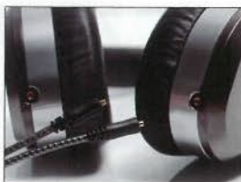
保留了可換線設計，採用了MMCX插頭。

Edition 5 unlimited依然沿用S-Logic、S-Logic PLUS的離心定位單元設計和精確阻尼計算，包括S-Logic EX、ULE (Ultra Low Emissions) 技術，加上有S-Logic EX專利技術，亦即是環迴漏斗式設計，會令音場、定位與空間感的還原度更高。到實際試聲時，以Astell&Kern AK120 II 直推耳機，聽首胡琳〈餓狼傳說〉，人聲感覺更靠前集中，由眾多樂器聲中突圍，但樂器聲依舊清晰並有層次地伴奏著女聲；再聽首DSD的MJ〈Thriller〉，更加發揮到耳機的特性，聲音極細緻而有力，三頻表現都相當稱職，表現絕不亞於限量版的Edition 5，反而可算是聽到另一種風味。