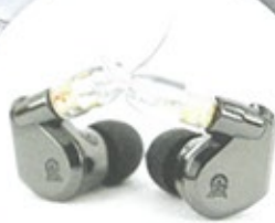
Campfire Audio Lyra