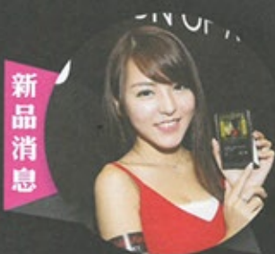
Astell&Kern AK380 旗艦登場