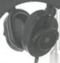
Master & Dynamic MH40