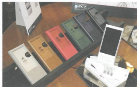
● AK Jr已有多款不同顏色的皮套選擇