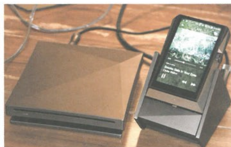
● 配件包括CD Ripper（左）及底座