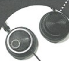
Philips Fidelio M2L