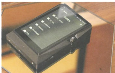
● 外觀貫徹品牌高階作使用的光影概念

售價：$28,800 (AK380) · $4,280 (AK Jr) 查詢：3188 0767 (ECT)