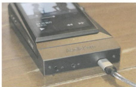
● 專用耳放跟機身連為一體