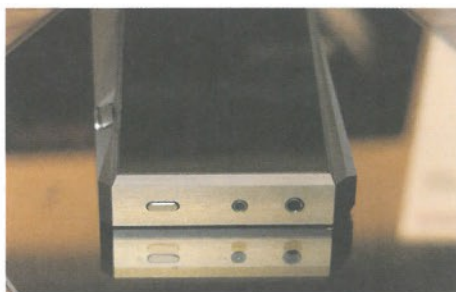
● 備有3.5mm TRS單端及2.5mm TRRS平衡輸出