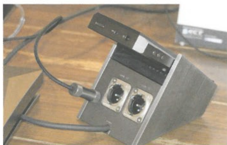
● 底座備有XLR平衡輸出