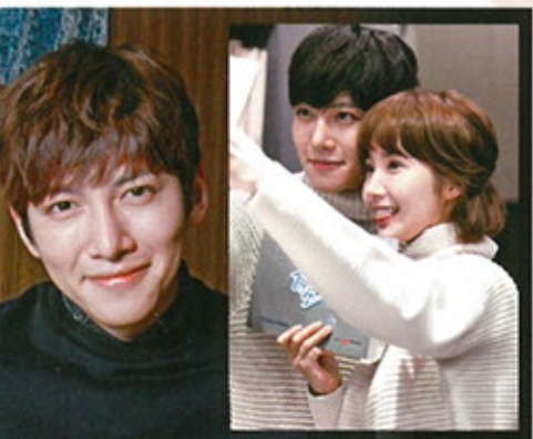
神 揀 女 專訪池昌旭 最愛朴敏英笑