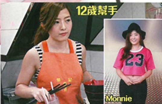
12歲幫手 食 客 $20 搭 訃 元朗牛雜妹 輸港姐想做星