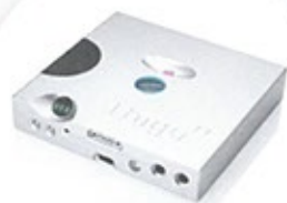
Chord Hugo TT