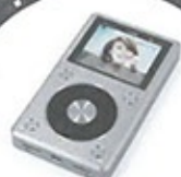
FiiO X5 II