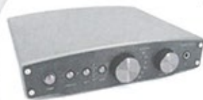
Asus Essence One MKII