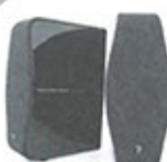
Focal XS Book Wireless