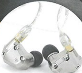
Campfire Audio Jupiter