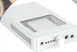
ALO Audio The Continental Dual Mono