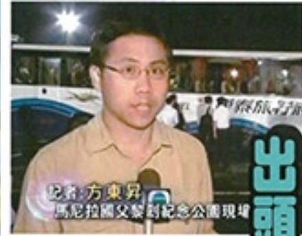
記者 方東昇 馬尼拉國父黎利紀念公園現場