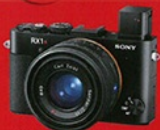
全幅機仔 Sony RX1R II