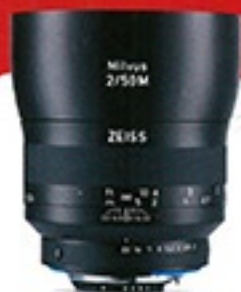
蔡司新系 Milvus 2/50M