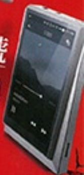
重裝二號 Astell & Kern AK320