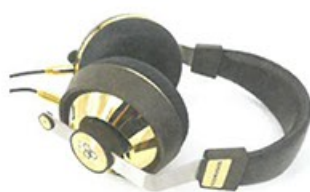
● 全機由不鏽鋼及ABS塑料組成