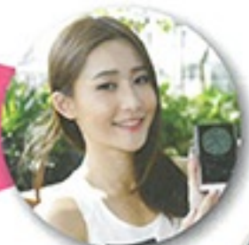
旗艦機能下放 Astell&Kern AK320