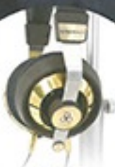
Final SONOROUS VIII