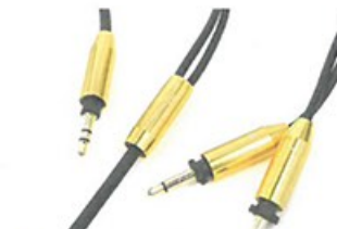
● 插座及分線位都以金屬製作