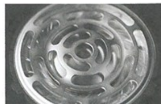
● 被鋁殼包圍的單元