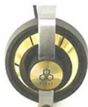
● 頭帶加有拉絲處理