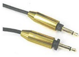
● 左右兩邊以2-pin插頭連接