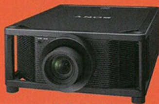
SONY VPL-VW5000ES 對比度無極限