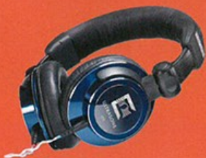
Ultrasone Tribute 7 全球限量新作