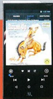
Acoustic Research AR-M20 靚聲 × 輕薄