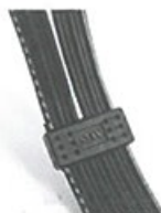
● 耳機線以並排方式排列