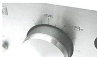
● 左右獨立音量控制