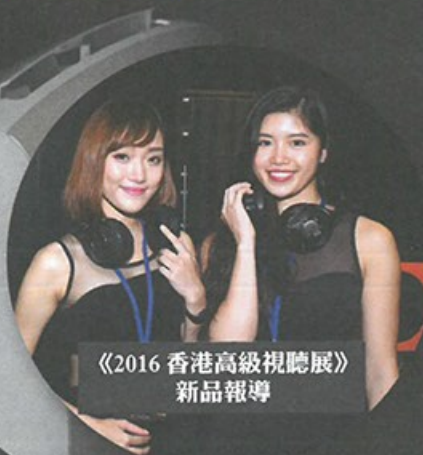
《2016 香港高級視聽展》 新品報導