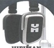
HIFIMAN Edition S