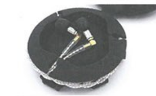
● 便攜套預留線纜的空間