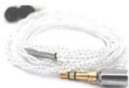
● 跟日本潤工社共同開發的鍍銀線材