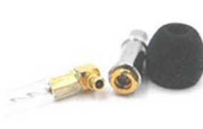
● 可換線設計、插頭為MMCX