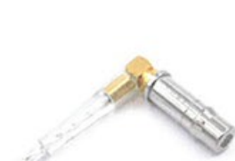
● 5.5mm直徑的不鏽鋼外殼