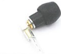
● 備有軟管協助固定耳膠