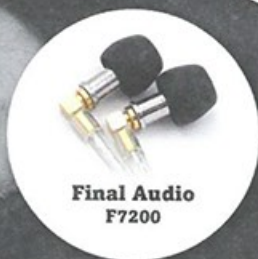
Final Audio F7200