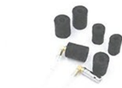
● 耳棉覆蓋整個主體