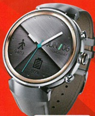
同級待機最長 Asus ZenWatch 3