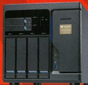
Core i3 電腦級 NAS QNAP TVS-682T