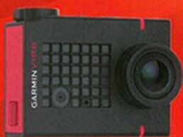
聲控 Action Cam Garmin VIRB Ultra 30