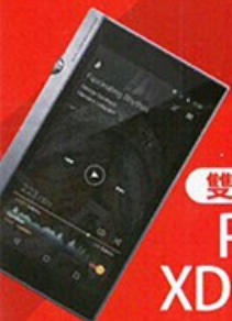
雙DSP雙生兒 Pioneer XDP-300R