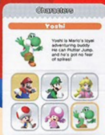
Super Mario Run 教你開齊五個主角陪跑