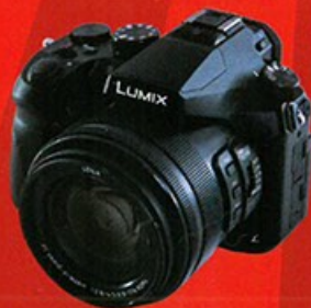
專業級攝錄 Panasonic LUMIX DMC-FZ2500