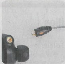
使用流行的 MMCX 介面。