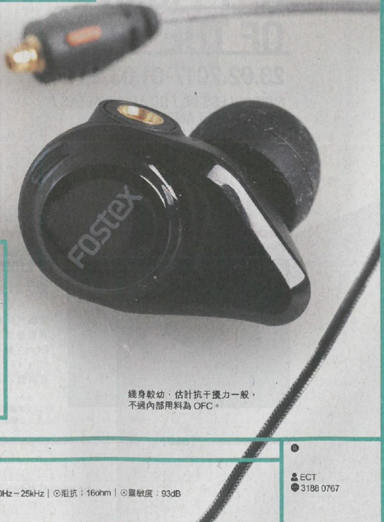
綫身較幼，估計抗干擾力一般，不過內部用料為 OFC。