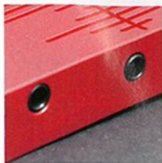
■ 機頂設有 3.5mm TRS 及 TRRS 耳機輸出端。

美國品牌 LH Labs 推出的 Go2Pro 外置解碼擴音機，創作團隊集合多個音響技術大師，從機身的鋁合金物料，以至機內採用的新一代 ES9018AQ2M 解碼晶片，均能對應到現行 32bit/384kHz 或 DSD 128 等高清音樂規格；機內並以 Class A 技術放大，設有 3 段的增益模式，最大輸出可達 1W，任何耳機或耳筒均適用。另外，機頂除設普通 3.5mm TRS 耳機插頭外，還備有 3.5mm TRRS 平衡輸出，可對應的配搭就更多。