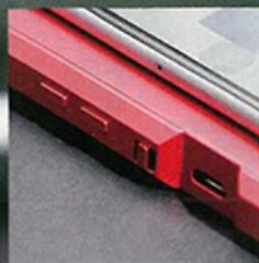
■ Go2Pro 機身厚度約 iPhone 6 的 1.5 倍。