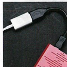
■ 機頂 MicroUSB 可連接《iOS》及《Android》智能裝置系統。

透過解碼及放大直出，輸出音效獨沽一味？Go2Pro 便特別增設 3 種數碼濾波模式：藍燈的人聲模式 (TCM)、綠燈的音場模式 (FRM) 及紅燈的串流模式 (SSM)。三種聲音轉換出的音色明顯，特別是串流模式，用以聆聽 Spotify、Tidal、MOOV 等串流應用程式，大幅減低串流音樂的背景雜訊；用戶無論是以《iOS》或《Android》系統，收聽內存的音樂檔或網上串流音樂，都能享極高細密度的聲音表現。